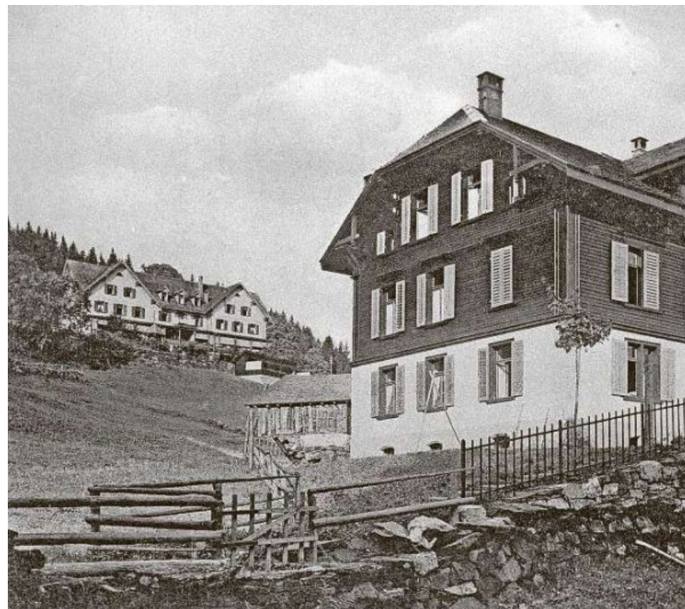
Der 1909 eigens errichtete Kinderpavillon des Sanatoriums Braunwald, im Hintergrund das Sanatorium. Die neuen Räume schaffen die Voraussetzung für eine auf die jüngsten Patienten abgestimmte Heilung.

Es geht also nicht nur um Heilung, sondern auch um Lebensführung – um Disziplin, Ernährung, Verhalten. Krankheit wird als medizinisches und zugleich soziales Problem verstanden. Die Patientinnen und Patienten sollen nicht nur genesen, sondern auch lernen, wie sie nach dem Aufenthalt gesund bleiben.