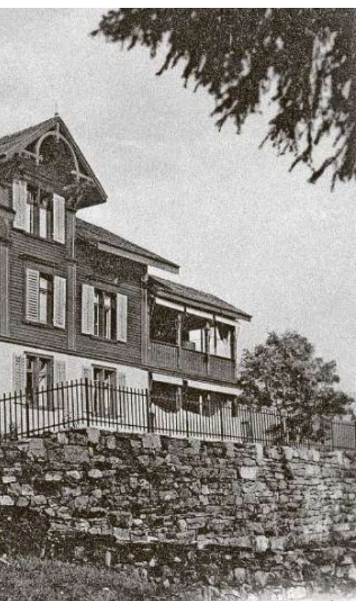
Hauptgebäude der Heilstätte: ... te Behandlung.