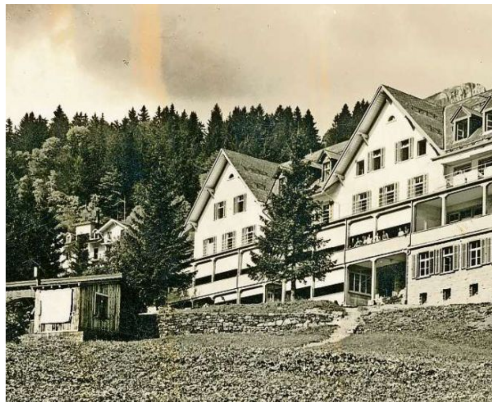
Das Sanatorium Braunwald im Sommer: Die Heilstätte liegt windgeschützt auf einer Sonnenterrasse oberhalb von Braunwald.