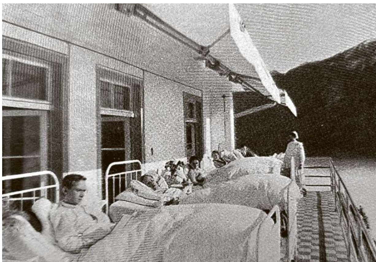
Liegekur auf der Sonnenterrasse des Sanatoriums Braunwald um 1928: In dicke Decken gehüllt verbringen die Tuberkulosekranken stundenlang an der frischen Luft – auch im Winter.